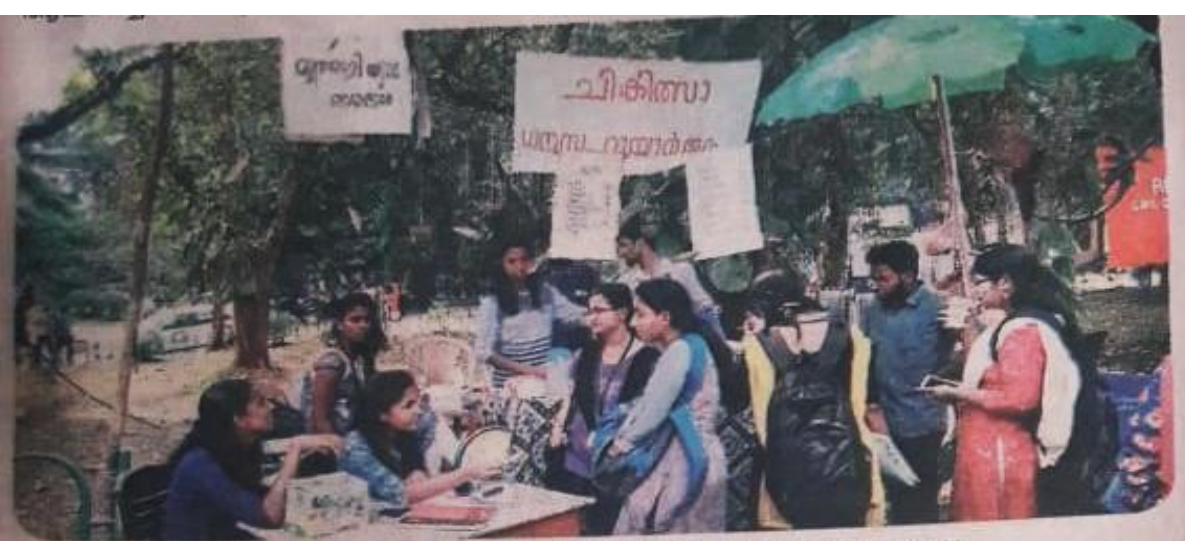
🔾 സി.എം.എസ്. കോളേജിലെ റെഡ് റിബൺ ക്ലബ്ബ് വിദ്യാർഥികളുടെ ലഘുഭക്ഷണശാല